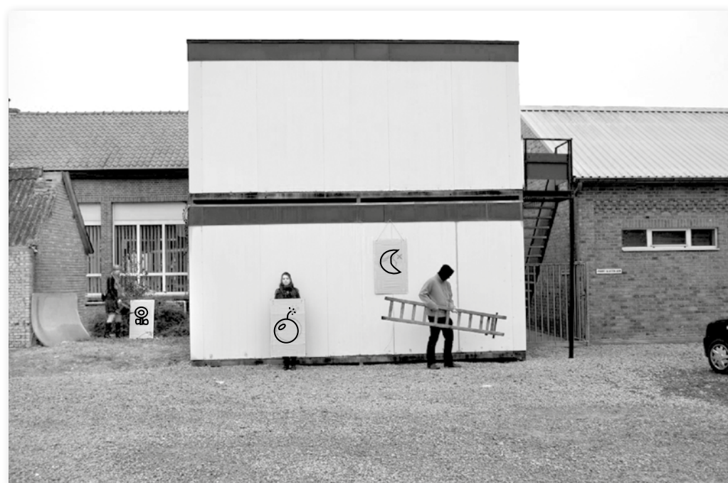
De bewoners plaatsten in 2014 een bom onder de manier waarop de school werd onderhouden.

Tien jaar na de instorting van de buurtschool in Godsheide, vond gisteren een feestelijke opening plaats van de nieuwe klasjes. Hiermee komt er een einde aan het verblijf van kinderen en leerkrachten in de scoutslokalen. De bouw van de nieuwe school werd mogelijk door de crowdfunding initiatieven van het sterke verenigingsleven in Godsheide. De idee achter crowdfunding is dat veel mensen een klein bedrag investeren en dat al die kleine investeringen samen het project volledig financieren.