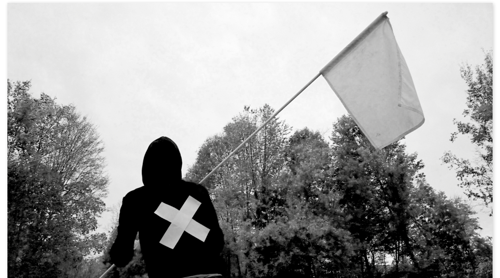
Bewoners heisen witte vlag op de stiltepicknick.

Met een stiltepicknick namen de bewoners op zondagochtend 1 december de golfterreinen van Godsheide in. De omliggende ruimte werd door diverse ontwikkelaars de laatste jaren volgebouwd, zonder aandacht voor de ontwikkeling van open ruimte. Vandaag zijn het vooral de bewoners zelf die de inrichting van de open of rest-ruimte op zich nemen en afspraken maken rond parkeren, speelstraten en gemeenschappelijke tuinen. Met deze stiltepicknick willen ze een gesprek openen met ontwikkelaars en beleid over het gebruik van de groene ruimte rond het golfterrein als speelplek en parkzone.